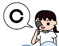
春の視力検査の結果